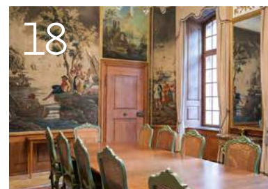
Der Basler Bürgerratssaal