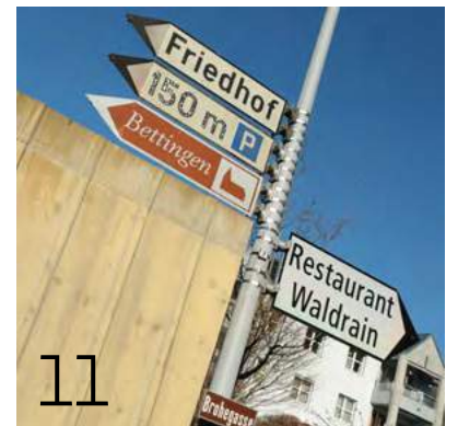
Die Kleinsten im Raum Basel