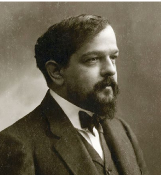
Claude Debussy (1862–1918)