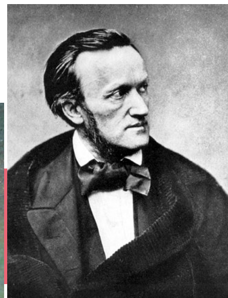
Richard Wagner (1813–1883)

haltensame Stücke. Heutzutage ist – wie in der Literatur – eine eindeutige Zuordnung oft gar nicht möglich und macht auch keinen Sinn.