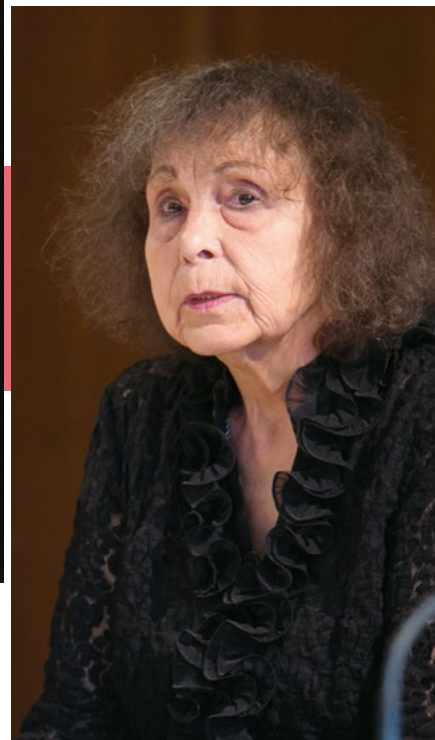
Sofia Gubaidulina (*1931)

mit seinen «Klubhaus-Konzerten» ebenfalls dafür ein, dass klassische Orchesterkonzerte mit bedeutenden Sinfonieorchestern von jedermann besucht werden konnten.