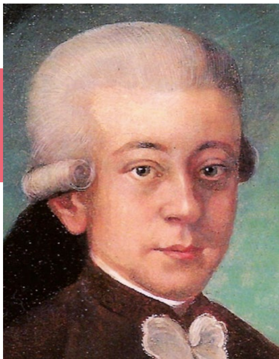
Wolfgang Amadeus Mozart (1756–1791)

Vom Barock über Klassik und Romantik zur zeitgenössischen Musik