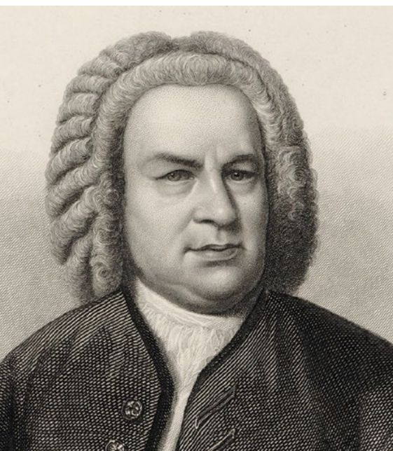
Johann Sebastian Bach (1685–1750)

Vom Barock über Klassik und Romantik zur zeitgenössischen Musik