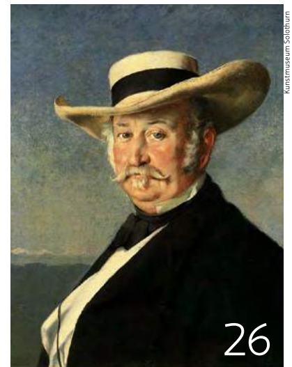
General Sutter, Gemälde von Franz Buchser