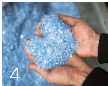
4 Plastik aus dem Meer