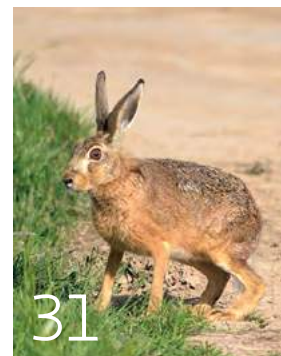
31 Der Feldhase