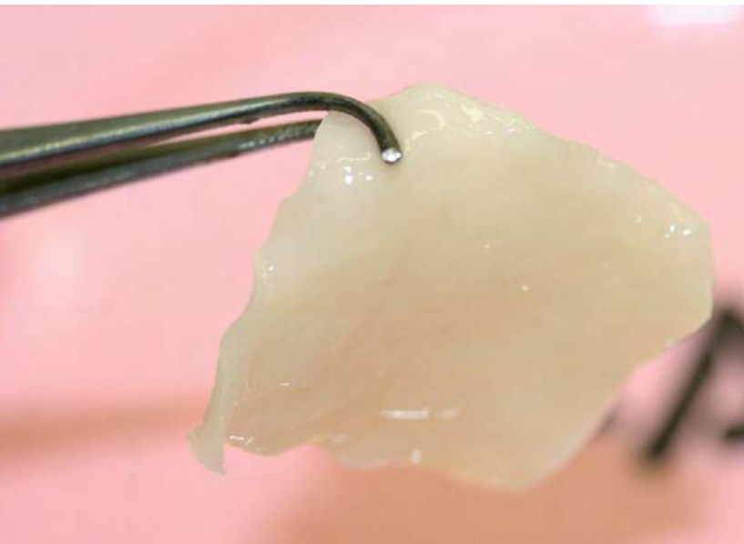
◀ Gezüchtetes Knorpelstück aus einem Labortest

Geklärt werden muss auch, ob kombinierte Behandlungen Sinn ergeben: das Gewebeimplantat kombiniert mit einer Entzündungsbehandlung oder mit einer mechanischen Gelenkskorrektur. Diese Informationen braucht es für die Bewilligung einer klinischen Studie und die Abschätzung von Nutzen und Risiko für die Patienten.