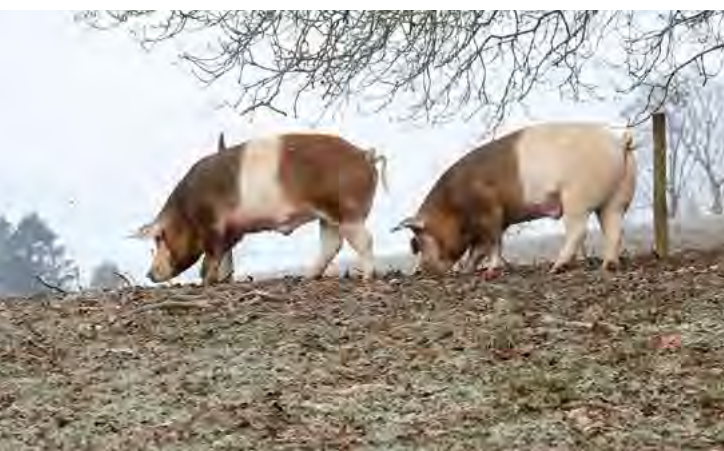
Markus Dettwiler geht oft mit Farni und Burgi spazieren.