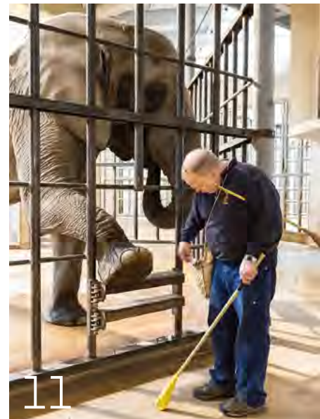
Brauchen Zootiere Krafttraining?