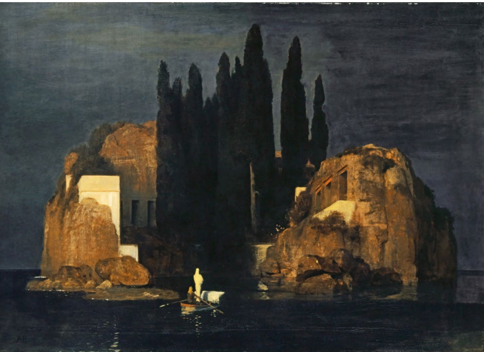
«Die Toteninsel» von Arnold Böcklin, eines der wichtigsten Werke des Symbolismus, Urversion von 1880.

Kunstmuseum Basel, Foto: Wikimedia Commons