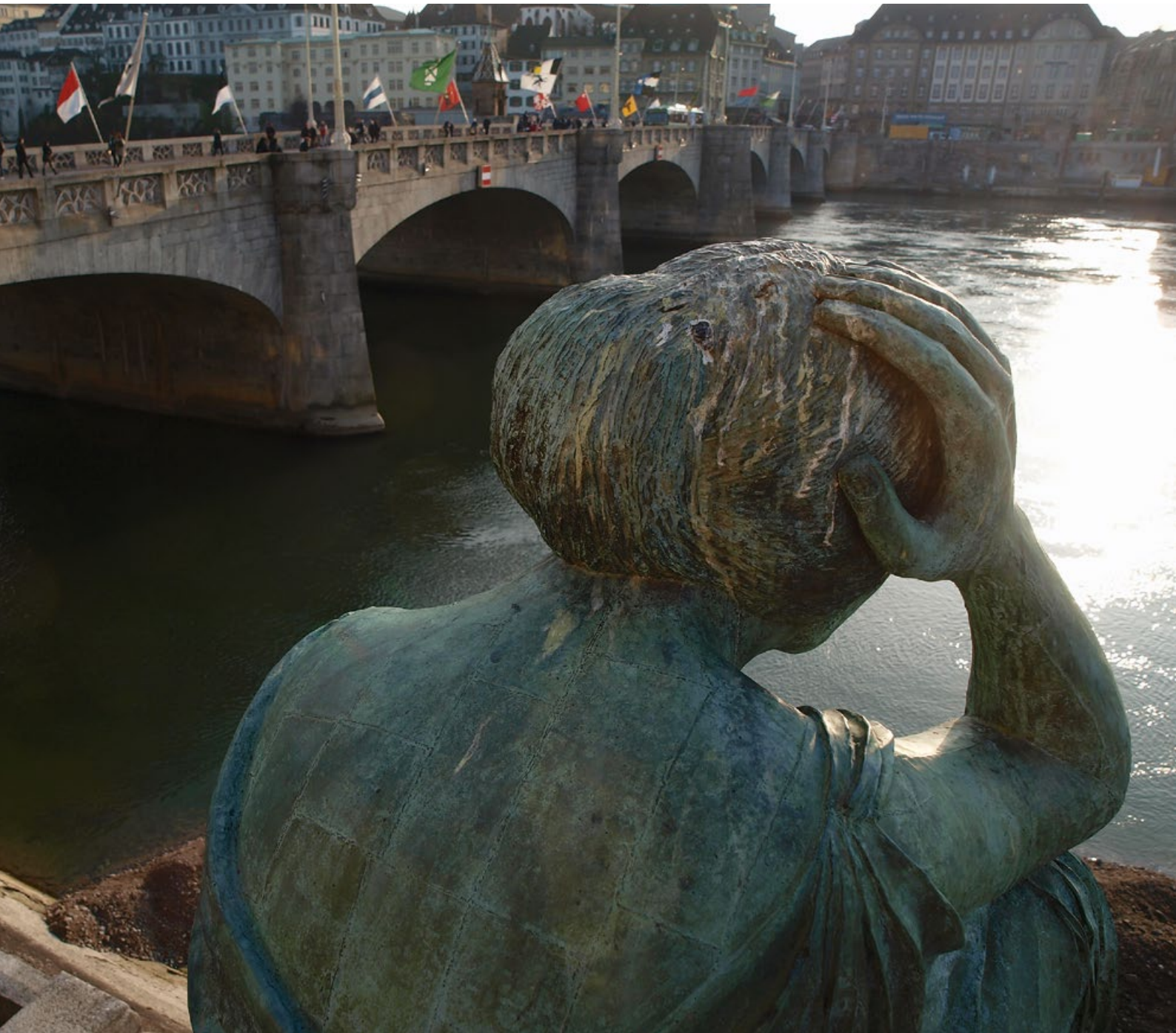
Die Skulptur «Helvetia auf Reisen» von Bettina Eichin schaut seit 1980 von der Mittleren Brücke aus dem Rhein nach.